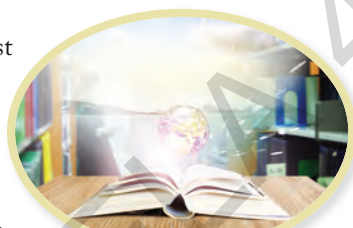
Educația în ziua de azi

(Petru Butuc, Despre noțiunile științifice de limbă literară și română literară )