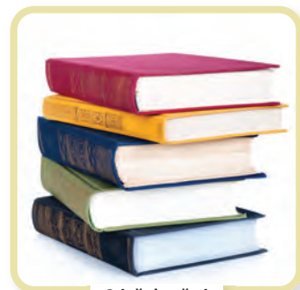
Stivă de cărți

Dificultatea cercetărilor asupra substratului limbii române provine din faptul că lipsesc informațiile privitoare la idiomurile care se vorbeau pe teritoriul cucerit de romani. Este posibil ca unitatea politică realizată de regii daci (de la Burebista la Decebal), din cauza pericolului roman, să fi determinat și o unitate lingvistică a triburilor atrase sub un steag comun.