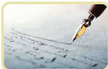
Stilou cu peniță

(Alexandru Stănciulescu-Bârda, 1987, p. 340)